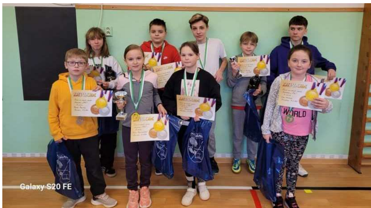
Kategorie děti a dorost

Všichni zúčastnění si dle mého názoru užili lité boje ve svých kategoriích. Důležité byla i společenská linka celého turnaje. Vítězům blahopřejeme a všem účastníkům turnaje děkujeme za účast, a především skvělou atmosféru.