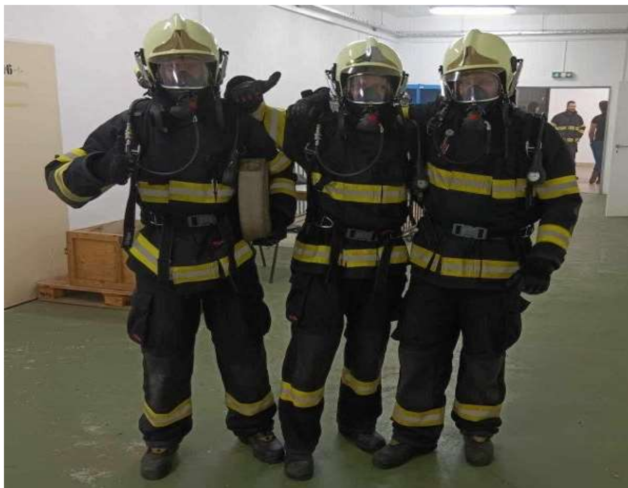
Foto: členové JSDH Jabloňany, kurz nositelů dýchací techniky