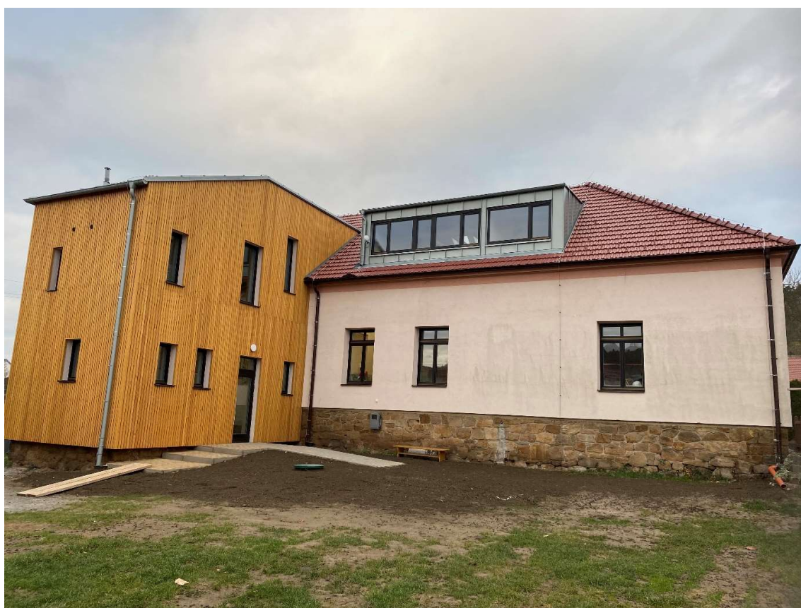
Oprava a přístavba místní školy