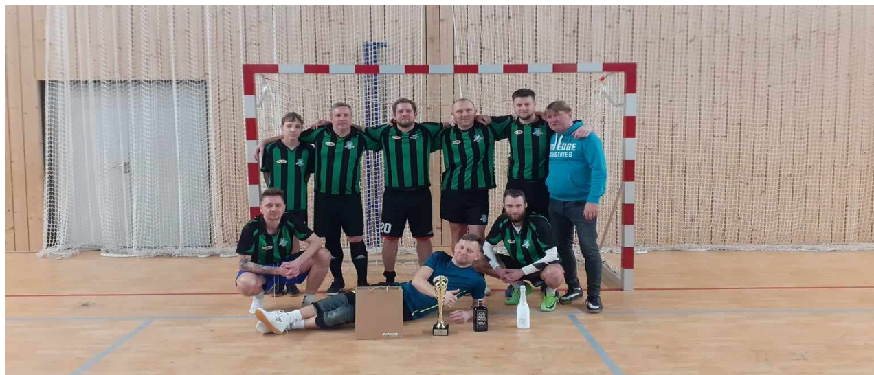
Hráči MK Jablonoňany ve Svitávce

Dne 3. února 2024 jsme byli pozváni na turnaj, který se uskutečnil v hale ve Svitávce. Na kvalitně obsazeném turnaji jsme získali 1. místo. Všem hráčům bych chtěl poděkovat za výborný výkon a bojovnost, která je provázela celým turnajem.