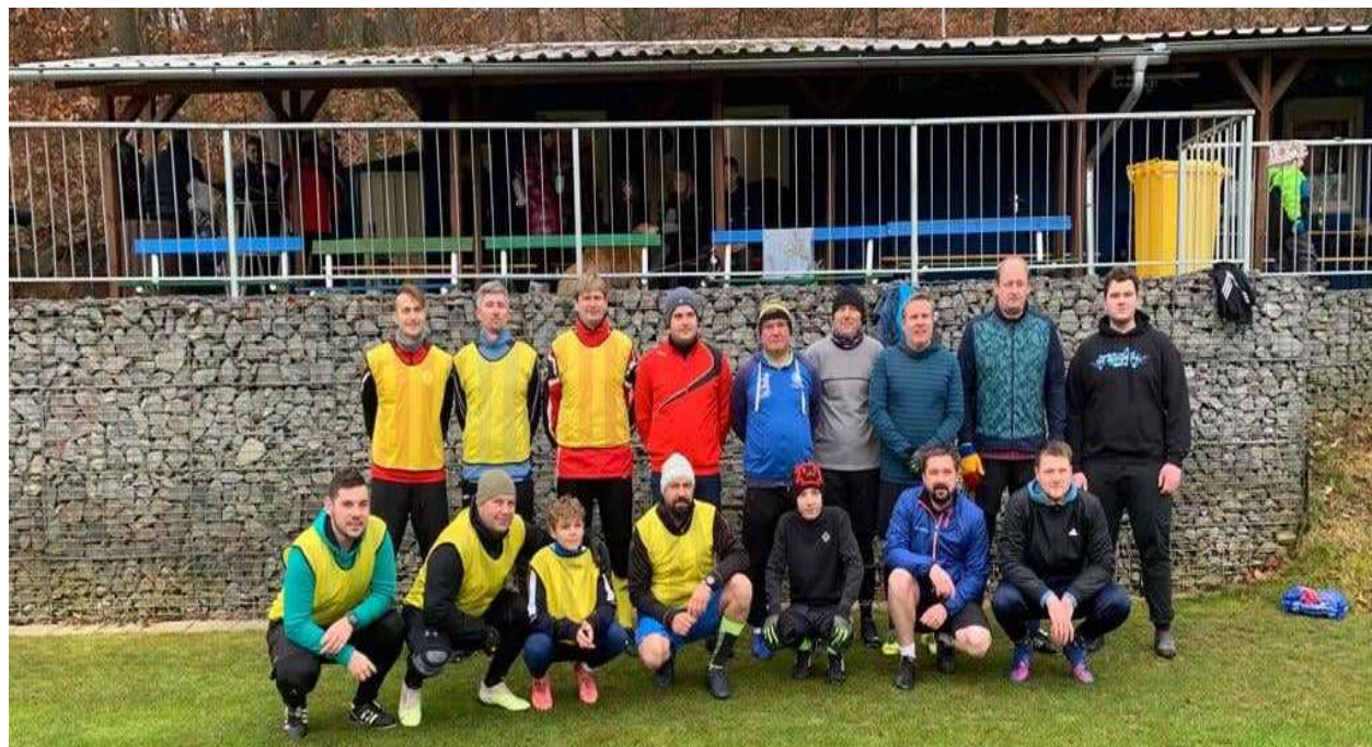
Silvestrovský fotbálek V Luhu

Úvodem bych se chtěl ještě vrátit ke konci roku 2023, který jsme zakončili tradičním posezením na hřišti v Luhu. Akce se díky příznivému počasí a libé vůni svařáku velmi vydařila a opět jsme se pobavili „sranda fotbálkem“.